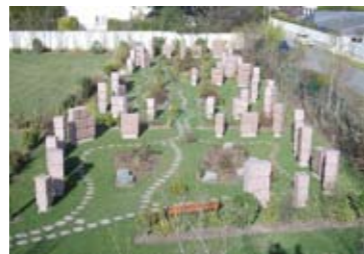
Vision globale du dernier site cinéraire.

En fait, cette réalisation a permis de répondre aux souhaits des familles en matière de sépultures après crémation mais aussi de satisfaire un voisinage proche qui ne voyait pas d'un très bon œil l'installation sous leurs fenêtres de nouvelles parcelles dédiées à l'inhumation. Le site végétalisé et les columbariums installés ont, semble-t-il, été appréciés.