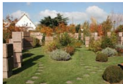
Les deux dernières tranches réalisées.

Dans l'ensemble, les Rueillois sont exigeants et nous tâchons de mettre tout en œuvre pour les accompagner. A titre d'exemple, une famille nous demandait récemment de réunir ses défunts dans son columbarium. Au regard du manque de place, la proposition du cavurne a donc été envisagée très rapidement. Comme je vous le disais, ceci représente la prochaine étape du développement de notre site cinéraire. Les familles souhaitent de plus en plus disposer d'un emplacement familial, de façon à réunir 4 ou 5 urnes. C'est une tendance à prendre en compte pour les années à venir.